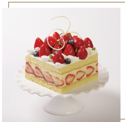
法式草莓 French Strawberry Cake