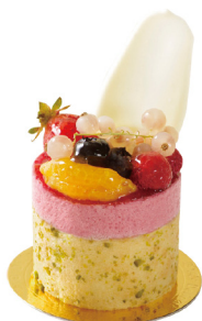
覆盆子香草蛋糕 Raspberry Vanilla Cake