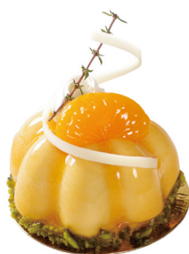
葡萄柚鳳梨慕斯 Grapefruit Pineapple Mousse