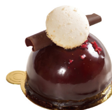
香蕉堅果慕斯 Banana Nuts Mousse