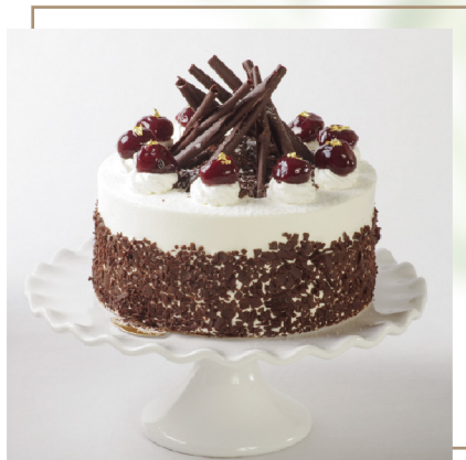
黑森林蛋糕 Black Forest Cake